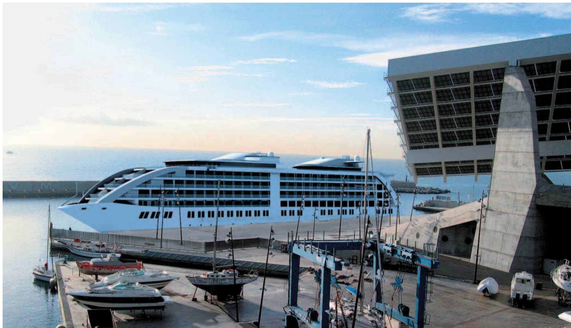
La imagen del 'Sunborn BCN'. La imagen del barco hotel, de nombre Sunborn BCN , es virtual, pero su aproximación a la realidad resulta de gran precisión