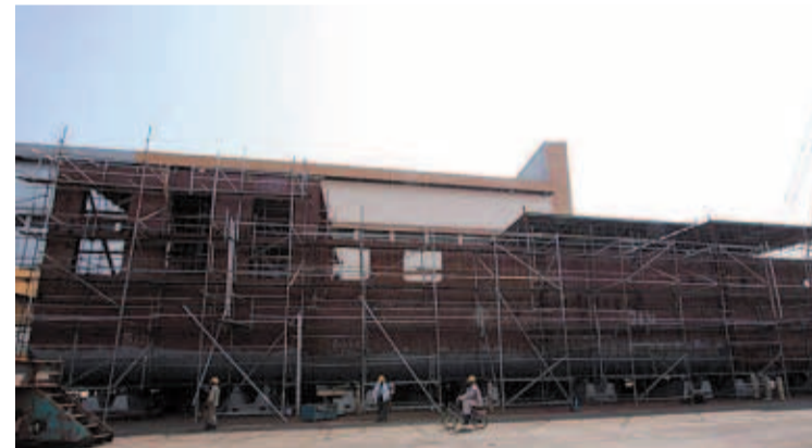
El caparazón. En los astilleros malasios de Lumut ya es visible el casco aún sin acabar del futuro barco hotel

Al concluir el interiorismo llegará la hora de navegar hasta su destino. La falta de potencia obligará a hacer trayectos cortos y se calcula que, según las condiciones del mar, el viaje se prolongará de un mes y medio a tres.●